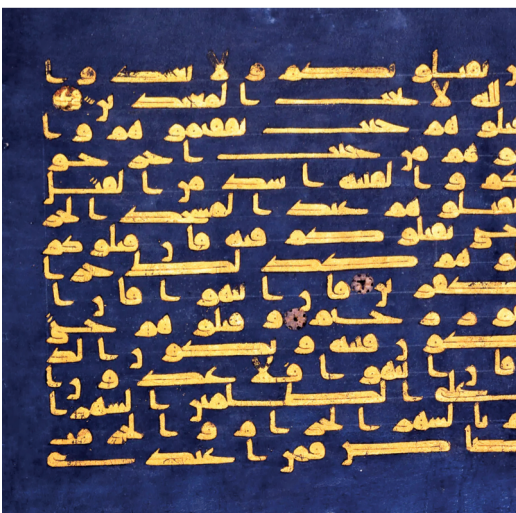
Blad af pergament fra en Koran.

Dauids Samling Kronprinsessegade 30, København K Frem til 26. januar 2025