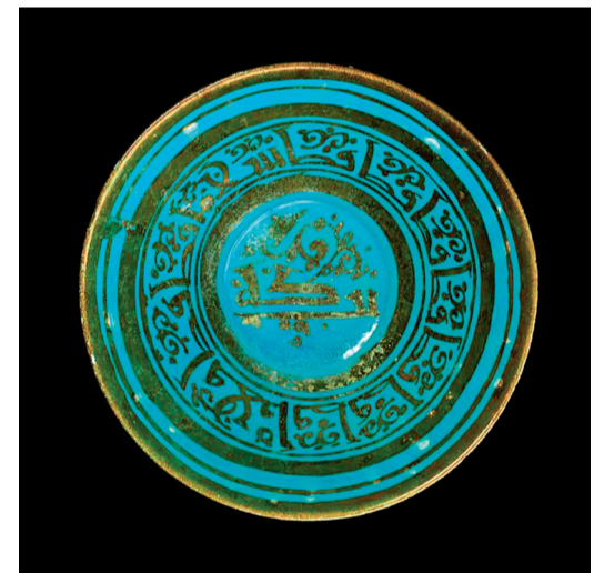
Skål af frittegods bemalet med lustre over turkis, opak glasur.

Det er ikke almindeligt at afbilde levende væsner sammen med religiøse tekster i islam. Det har ført til eksempler på meget fantasifuld brug af skriften, som når man fx. fletter skrift og planteornamentik sammen. Det giver mulighed for at