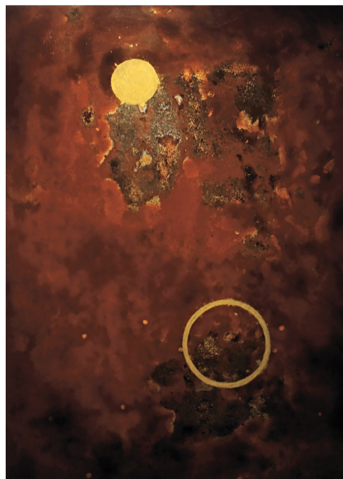
Thao Nguyen Phan - Perpetual Brightness. 2019.

to, nærmest banale, men evige symboler på håb og fred: en fredsdue i stof og gips og et gipsrelief af en solsikke, belyst bagfra. Duen udtrykker det naive, stiske fredsbudskab, og solsikken skal symbolisere tro og trofasthed overfor det kommunistiske parti.