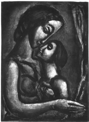
Det ville være så smukt at elske.