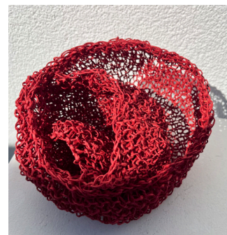
STRIK EN STUND

Se detaljeret program på www.loegumkloster-refugium.dk