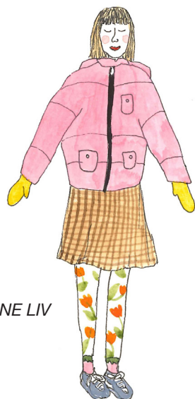
AT TEGNE LIV