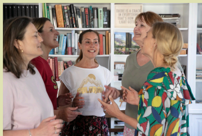
HVER FUGL SYNGER

Se detaljeret program på www.loegumkloster-refugium.dk